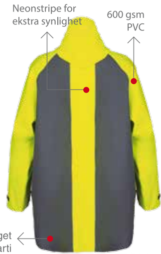
MILFORD 249 BAK