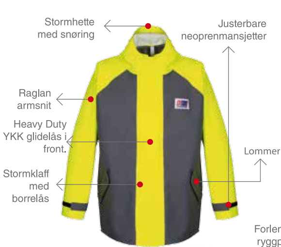
MILFORD 249 FRONT