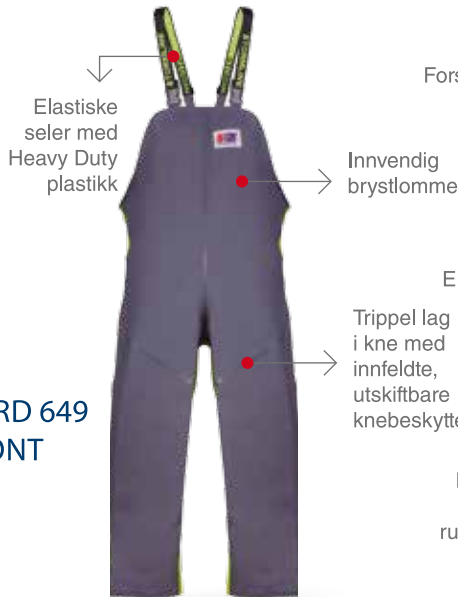
MILFORD 649 FRONT