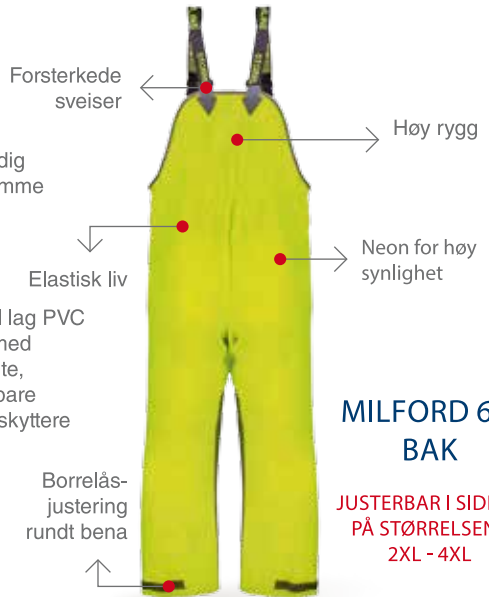
MILFORD 649 BAK

JUSTERBAR I SIDENE PÅ STØRRELSENE 2XL - 4XL